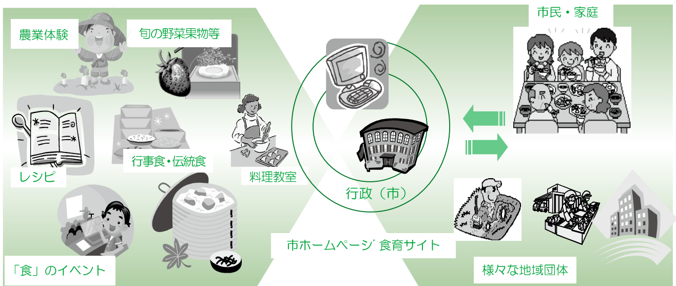
【市のホームページ上の食育サイトイメージ図】

また、本市においても国の「食育推進基本計画」により定められた毎年6月を「食育月間」、毎月19日を「食育の日」とし、食育の気運を高めていきます。