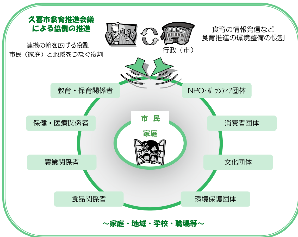
【今後期待される食育推進会議を中心とするネットワークイメージ図】