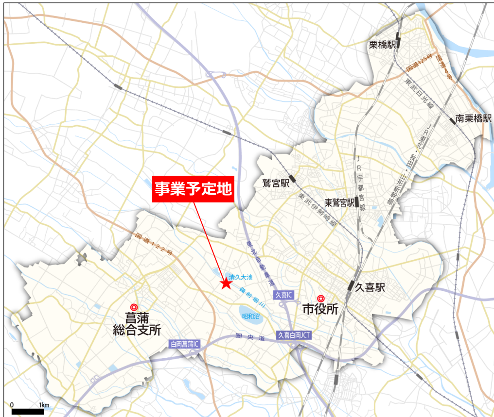
図 1 事業予定地位置図