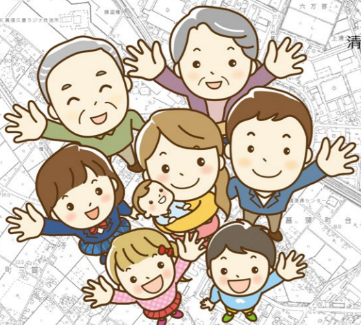
●久喜市市内循環バス時刻表