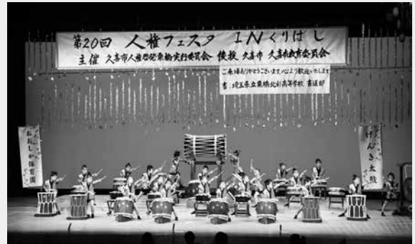
▲おおしか保育園の太鼓演奏