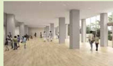
見学者ホール ← 広々とした