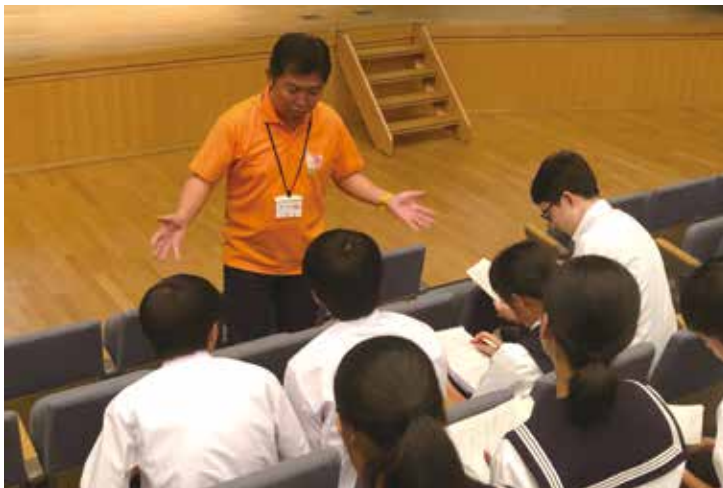
▲梅田市長が中学生サミットで都市宣言について説明する様子

市では、スポーツや運動など身体を動かすことにより誰もが心身ともに健康となり、活気あふれる元気なまちになるということ、市民の皆さんとともに宣言したいと思います。その宣言文について、候補を3案作成しました。宣言文に最もふさわしい、実行してみようと思うのは案1、案2、案3のどれでしょうか。多くの市民の皆さんのご意見を募集しています。