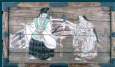
鷺宮催馬楽神楽図(鷺宮神社蔵)

絵馬とは、人々が様々な思いを込めて社寺に奉納した板状の絵額です。社寺の奉納所などに掛かる小さな板絵を思い浮かべる人が多いと思いますが、このような形の小さい「小絵馬」に対して、大型の絵馬を「大絵馬」と呼んで区別しています。