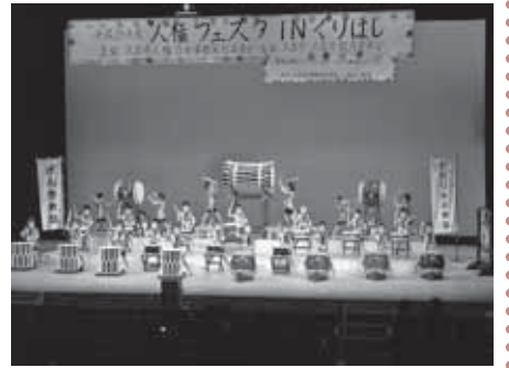
昨年のアトラクション (おおしか保育園による和太鼓演奏)