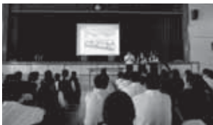
▲生徒会朝会で中学生サミットの報告

中学生サミットの後、サミットで行われたことを生徒会朝会で報告しました。菖蒲南中の良いところをこれからも守り、いじめを起ささないようにしようという気持ちが高まりました。