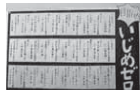
▲いじめゼロ標語の掲示