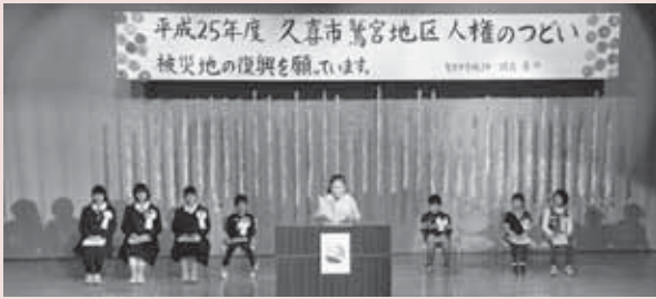
▲小・中学生による作文の発表