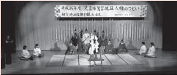
▲土師一流 催馬楽神楽