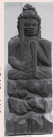
木造不動明王坐像

江戸時代初期の遊行僧・円空は、各地の霊山を巡り、生涯で12万体の仏像を彫ったと伝えられています。