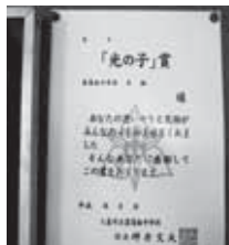
▲菖蒲南中善行賞「光の子」賞