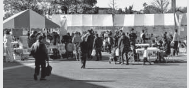
▲出店テントの様子