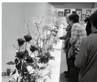
昨年の「森下公民館まつり」の様子