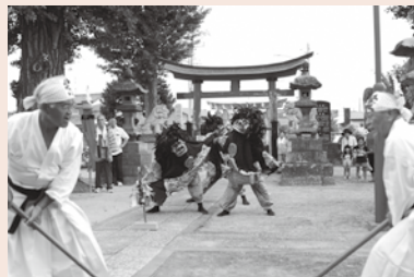
▲中妻の獅子舞・棒術

日本の代表的な民俗芸能である獅子舞は、主に厄除けや雨乞いなどを目的に行われています。市内では除垢・中妻・八甫・西大輪・古久喜・吉羽・小林の7地区に獅子舞が伝わっています。市内の獅子舞は舞手が1つの獅子頭をつけて舞い、獅子3頭(雌の獅子1頭と雄の獅子2頭)が1組となって舞を行います。1つの獅子に2人以上が入って舞を行う「2人立ちの獅子舞」に対して、これらの獅子舞は「1人立ちの三頭獅子舞」などと呼ばれます。獅子たちは笛や太鼓の演奏に合わせて舞いますが、その際に竹をすりあわせる楽器「ささら」が演奏されることがあります。地元ではこの楽器の名前にちなんで、獅子舞のことを「ささら」と呼ぶこともあります。