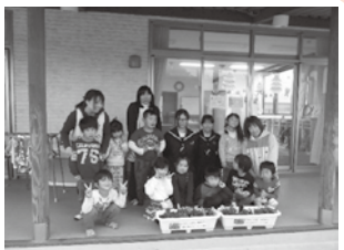
▲地域のボランティアの様子

菖蒲中学校では、今回の中学生サミットを通して、いくつかの新しい取り組みを始めました。1つ目は、目安箱の設置です。毎月テーマを決め、全校