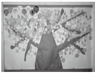
▲感謝を伝える「ありがとうの木」

今回の中学生サミットではたくさんのお話を学ぶことができました。「理想の学校を創る」ためには、今回意見交換した内容を活用すること、そして、他