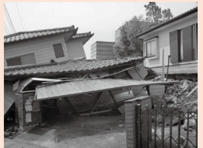
▲平成28年4月の熊本地震での木造住宅の被害