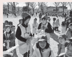
▲12歳のハローワーク

現在、豊かな人間性・大きな可能性・未来を生きるたくましい力をもつ子どもたちに育成するために、保護者・地域とともに新しい教育の推進に努めています。今年のはじめて校内に田んぼを作り、米作りをしています。また、1日職場を体験することにより、働くことの意義や社会との関わりを考える機会を作っています。