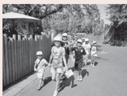
▲異年齢で楽しむ全校遠足

また、「絆アップ」では、地域の方との運動会に3年前から取り組んでいます。このような触れ合いを通し、地域の方と顔見知りになり、絆も深まっています。これからもさらなるレベルアップを目指します。