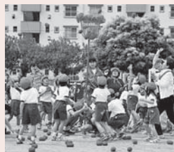
▲地域と触れ合う運動会

特に「心アップ」では、106人 ▲地域と触れ合う運動会の児童で異年齢グループを編成し、「上内小秋まつり」や「全体遠足」などに取り組んでいます。このような活動を通し、大家族のような心の温かさが育っています。