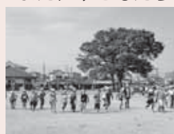
▲なかよレタイムで楽しく活動

また、子どもたちが安心・安全に過ごせるよう、保護者や地域の方がさまざまな活動に協力しています。一人一人の“美しき種子”を咲かせるべく、まさに学校・家庭・地域が一体となり、子どもたちを見守っています。