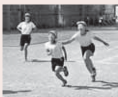
▲鬼ごっこを楽しむ場面

本校は、1909年に現在地へ新築・移転し、鷺宮の歴史とともに歩んできた学校です。▲ドッジボールを楽しむ場面 現在、学校として取り組んでいるのが、学力向上と異学年交流です。特に異学年交流は、月1回第2木曜日の8時15分から15分間、1年生から6年生までの10人編成で活動しています。上級生が下級生を思いやり、仲よく協力し、信頼し支え合おうとする人間関係の育成に力を入れて「ふれあい活動(縦割り班活動)」を実践しています。異年齢集団からなる人間関係を通して、豊かな心を育成していくことを目指しています。