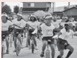
▲「ウイーゴー! 一輪車!!」