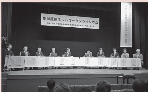
▲パネルディスカッションの様子

3月23日(土)、久喜総合文化会館小ホールで地域医療ネットワークシンポジウムが行われました。