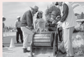
▲地域のお年寄りとの脱穀

学校応援団では、あいさつ、安心・安全、自然環境、学習遊びという応援団組織が、子どもたちを支援しています。学校ファームでは、田植え、稲刈り、脱穀を地域の皆さんの協力で体験し、収穫した米は調理実習や給食