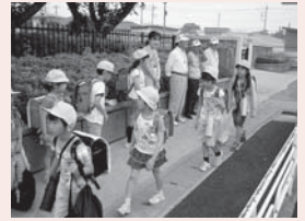
▲区長さんによるあいさつ運動