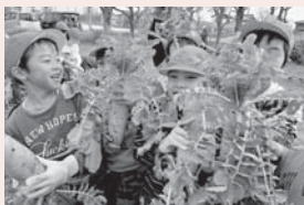
▲見て見て! すごいでしょ

毎日の水やりの仕事や炎天下での草取りは大変な作業ですが、作物が育つ様子を身近に感じて、収穫の喜びを味わうことは子どもたちの心の成長に大きく繋がっています。今は、ジャガイモがぐんぐん育つ時。東っ子の心も成長の時です。