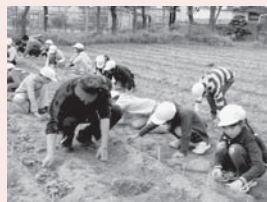
▲「大きく育て！」の願いを込めて

本校には、正門を入ると右手に「学校農園」があります。ここで東っ子200人は、『働くことの大切さ』や『命の尊さ』を学んでいます。