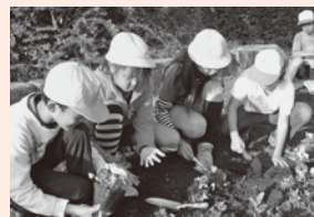
▲道のオアシスの花壇手入れ

6年生が毎年、社会科見学で日比谷公園を訪れて、博士ゆかりの「首かけイチョウ」に触れる学習や、菖蒲「道のオアシス」にある博士の記念公園の花壇の手入れもしています。