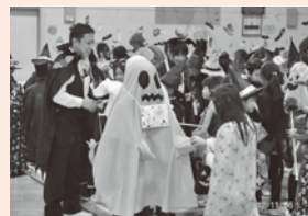
▲外国語活動 (ハロウィーン集会)

本校は、明治6年の開校以来、地域とともに歩んできた伝統ある学校です。大イチョウや樹齢を重ねた桜をはじめ、緑豊かな環境の中で、明るく素直な子どもたちがのびのびと活動しています。秋には、地域の方にも出品していただく作品展や老人会の皆さんと一緒に昔遊びを楽しむ集会、栢間地区青少年を守る会による「グラウンドゴルフ&餅つき大会」なども行われています。