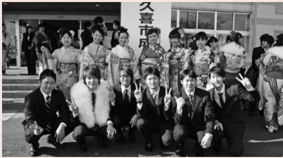
▲驚宮地区の成人式