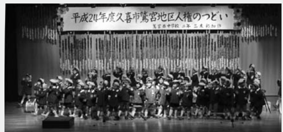
▲驚宮保育園による歌の発表

平成24年12月8日(土)、驚宮西コミュニティセンター(おおとり)で驚宮地区「人権のつどい」が開催されました。