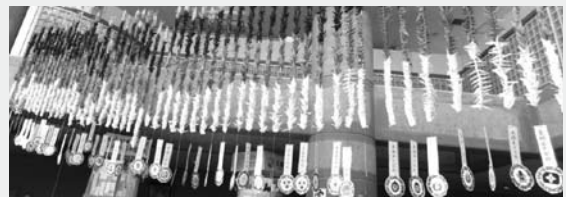
▲被災地への復興の願いを込めた折鶴