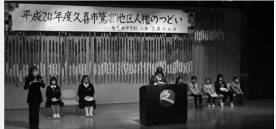
▲小・中学生による作文の発表