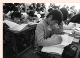
▲考えを深める書く活動

また、日本伝統文化や環境・職場見学等、地域ボランティア等の支援によるさまざまな体験学習を行っています。