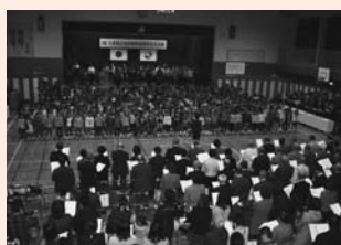
▲参加者全員での大合唱

みつないできました。「つながってきた今！ つながってゆく未来!!」をスローガンに、開校30年目を生きる児童は、全校で知（読書）・徳（合唱）・体（長縄8の字跳び）に取り組みました。目標を16,630冊に設定した読書の数は25,238冊に、目標1,570人だった長縄8の字跳びは2,516人が達成しました。そして、30周年の式典では、毎日練習した合唱「今日もどこかで」を響かせました。