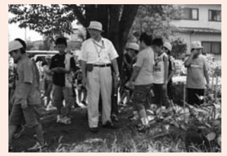
▲季語を探す俳句教室（サマースクール）

今後も朝の運動、朝トレの工夫、俳句・読書（朝読・家読10）・ほくと（善行）賞の実施等、知・徳・体のバランスの取れた「学ぶ意欲に満ち活力あふれる学校」を目指していきます。