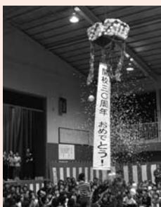
▲お祝いのくす玉割り