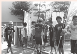
▲朝のあいさつ運動

また、全学年で算数科の少人数指導を行い、一人一人が学ぶ楽しさを実感できる学習に取り組んでいます。「たくさん発表できる」「よく見てもらえる」などの理由で、算数の学習が好きと答えている児童は全体の80%を超え、少人数指導の成果が現れています。