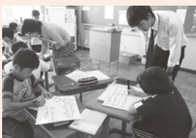
▲算数科の少人数指導