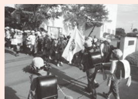
▲あいさつボランティア