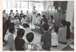
▲6年生・茶道体験教室

本校では「ことば」「かわり」「体験」をキーワードに、知・徳・体の調和のとれた児童の育成を目指して、日々の教育活動を推進しています。地域の力をお借りした茶道教室、プロの技を肌で感じる文化芸術体験事業、各学年の親子ふれあい活動などさまざまな体験活動を通して、人との関わりや感動を言語活動につなげています。JRC (青少年赤十字) 活動にも力を入れ、朝のあいさつ運動や落ち葉掃き、公園の清掃活動、親子動物飼育など、家庭や地域の協力を得ながら、主体的に行動できる力の育成を目指しています。