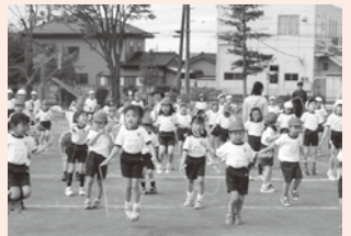
▲生き生きタイムでの全校なわとび

リズムなわとびクラブは毎年、なわとびフェスタで華麗な演技を発表しています。また、埼玉県なわとび選手権大会にも連続出場して立派な成績を収めています。