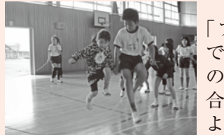
▲ファミリーで楽しく長なわとび

小規模校の特性を生かし、豊かな心の育成を目指して異学年集団「なかよしファミリー」の活動を行っています。6月には、江二小伝統の「カレー集会」を行いました。農園のジャガイモを「ファミリー」で収穫し、リーダーを中心に5・6年生がカレーを作ります。各グループごとに1つ隠し味を加えたカレーをみんなで味わいながら、楽しく会食をしました。