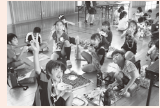
▲ひと味違うぞ、カレー集会

また、毎日の業間運動も、「ファミリー」のメンバーで行っています。ファミリーの仲間と共に、楽しく教え合いながら基礎体力を高めようと、いろいろな運動に進んで挑戦しています。