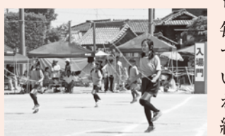
▲運動会でのリズムなわとびクラブの演技

本校の伝統は「なわとび」です。体育の授業や業前、休み時間などに全校で取り組んでいます。