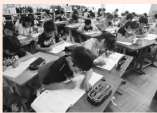
▲千字：考えを深める千字タイム

今後も139年の歴史と伝統を継承し、家庭・地域と協働して、賢く豊かにたくましい児童の育成に励みます。