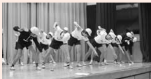
▲百吸・万歩：投力を高めるめんこ教室

一読では読み聞かせボランティアによるお話ポケットを、十笑では地域の方に参加いただき笑顔であいさつ運動を行っています。また、百吸・万歩の取り組みとして毎朝の全校マラソンの実施、千字タイムやことばタイムを新設し言語能力の育成を図る等、「チーム久喜小」を合言葉に教育活動の工夫に努めています。