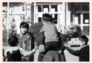
▲異年齢のふれあい