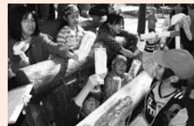
▲太田フェスタ もぐらたたきゲーム

今年度は、「全校徒歩遠足」の実施に向けて、コース決め・しおり作成などを合わせて取り組んでいます。全校徒歩遠足は、学区内の公園を巡って遊んだり弁当を食べたりして半日活動します。