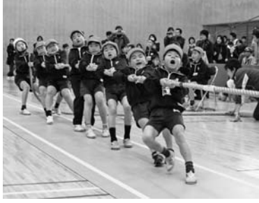
昨年の綱引大会の様子

※選手8人、監督・マネージャー各1人、交代要員2人以内でチームを編成してください。