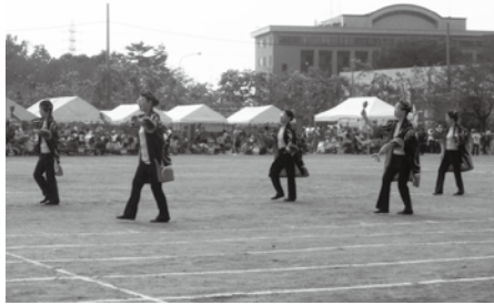
昨年のアトラクションの様子

対象 鷺宮地区で活動している団体 申込期限 8月31日(金) 17時 申込方法・問合せ 申込書(鷺宮温水プールで配布)に必要事項を記入の上、同プール(☎59・2288)へ