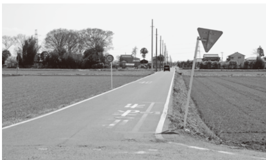
県道阿佐間幸手線から市道栗橋680号線を望む

道路整備には、多額な費用、地権者の協力が必要となり、長い期間を要しますが、本計画画道路は重要な路線であり、早期に整備したいと考えています。