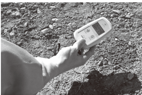
貸し出ししている放射線量測定器