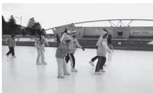
昨年のスケートのつどい