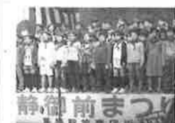
静御前まつりが栗橋 で盛大に行われました

市は人が集まり賑わう市のシンボルとなるよ うな公園や施設”魅力ある集客施設”を 目指しごみ処理施設の余熱を利用した施設と公園 の一体整備を進める計画です。このため市民 参加のプロジェクトチームを発足しました。 また、現在のごみ処理施設が老朽化している