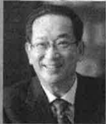
北川正恭 早稲田大学名誉教授