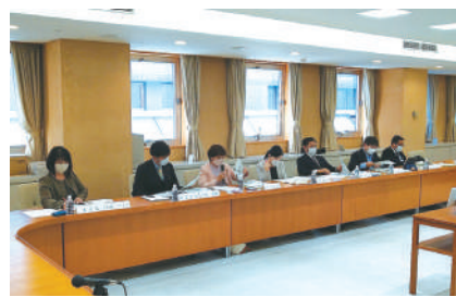
河内長野市役所にて説明を受ける委員