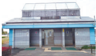
総合運動公園グラウンドの屋外トイレ

A 現在休止中の市民プールの場合に、スケートボード場や3×3（スリー・エックス・スリー）バスケットボールコートなどの整備及び市民グラウンドの改修等を検討している。今回の改修に伴い、総合運動公園の利用者の増加が見込まれることから、屋外トイレの増設についても検討している。