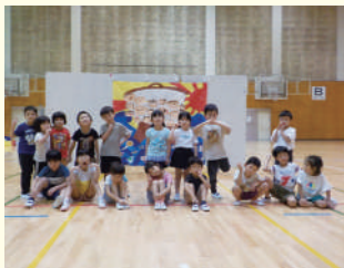
運動会のリハーサルにて