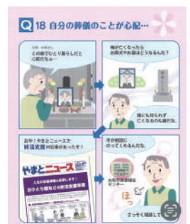
「おひとり様などの終活支援事業」について

その他の質問 ◇子供のインフルエンザ予防接種費用助成について◇市道久喜4号線の安全対策を