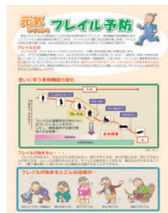
「介護予防パンフレット」