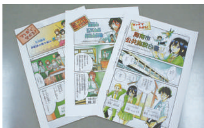
公共施設について漫画で説明

保有施設の維持管理に課題。理解を得るため漫画を活用して施設毎に議論を行い、公共施設の再配置の必要性を訴え、地域ごとの機能を維持しながら建物の集約を進めている。