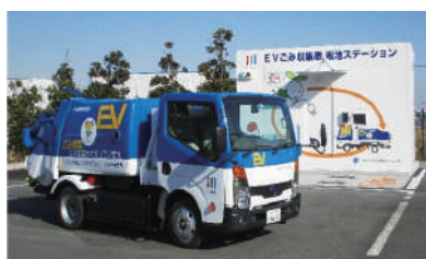
川崎市のEVごみ収集車

Q 新ごみ処理場では発電施設があり、その充電器で電気代はまかなえる。ごみ収集車・パッカー車をEV車に転換を始めたのは川崎市だ。まだ事業も始まったばかりなので、1台の価格は約1900万