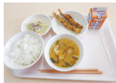
十日町市でいただいた給食

地場産農産物の、生産者組織による学校給食への納品など、地産地消率、県内トップの取り組みの説明を受け、給食を喫食。