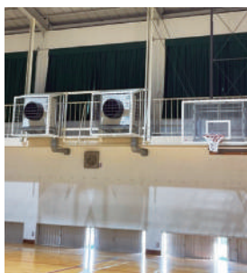
避難所としての体育館に設置されているエアコン

令和4年9月1日現在の屋内運動場へのエアコン設置状況は全国調査によると11.9%と公表された。埼玉県内の小中学校体育館エアコン設置の状況を伺う。