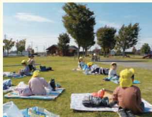
園外保育でみんなでお弁当