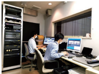
「録音室」 ※撮影のため、室内を明るくしています。

議場に隣接したところに、録音室があります。議会事務局の職員2名体制で、議会の進行を確認しながら、細かな操作を行っています。