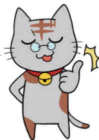
ギ飼い猫 (名前はまだない)

インターネット議会中継は、どこで、どのように作られているのかな? 録音室を覗いてみよう!