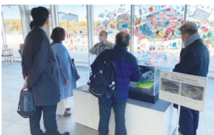
北広島市役所にて説明を受ける委員

駅を中心に東西をつなぐ立体通路は自転車が楽に通れる。市民プラザや店舗もあり集いの場であった。先を見据えたまちづくりは参考となる。