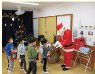
クリスマス会の様子