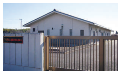
下栢間地区集落排水処理施設