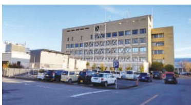
増築が検討されている本庁舎

Q 本庁機能の集約と子育て支援施設、保健センター等を含んだ本庁舎の増築の規模は。