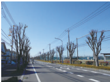
南栗橋の街路樹剪定状況