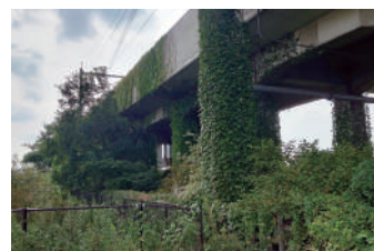
新幹線高架下の雑木・雑草

A 新幹線高架下の管理者であるJRに依頼したところ、JRから現地を確認し伐採等の対応を検討したいと回答をいただいている。