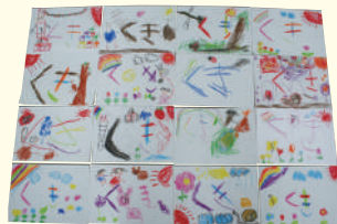
いただいた題字案の全部です!