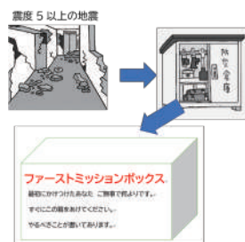
ファーストミッションボックス

A 大規模災害時は、市をはじめ防災関係機関の対応には限界があるため、地域住民が自主的、組織的に防災活動を行うことは重要。