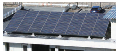
自治体の建物に設置された太陽光発電