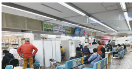
市役所一階窓口の様子

Q 令和6年度の組織機構改革で現行の組織が大きく変わる。現況の分散された課をまとめていくためにも本庁舎の増築が必要では。