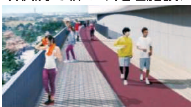
「賑わい機能」としてゴミ処理場に付帯されるランニングコース

Q このような財政状況で新ごみ処理施設に付帯される賑わい機能（ゴミ処理に関係の無いジョギングコースや屋上庭園）は必要か。