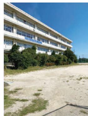
鷺宮東中学校の伸びすぎた樹木