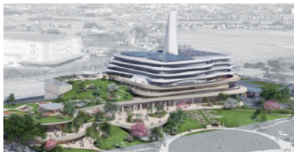
久喜市が公開している新ゴミ処理施設のイメージ

Q 「環境に配慮」とは自然に近い状態を維持し、自然環境を守り、人間や動植物への影響を最小限に抑える事が重要ではないか。必要以上の華美な造形をせずに無駄を省き費用の節約をすべきだ。