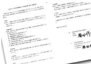
久喜市と久喜市内郵便局との包括連携に関する協定書

Q 市と郵便局の連携で生まれる住民生活等のサポートや行政サービスの補完は、地域課題解決の一助になると考える。①これまでの連携状況