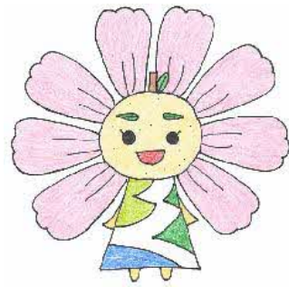
久喜市内小・中学校 マスコットキャラクター 「はぴるん」