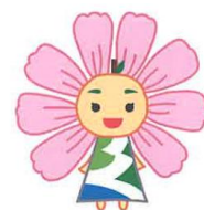
久喜市内小・中学校 マスコットキャラクター 「はぴるん」

久喜市立学校給食センターでは、最大100食の食物アレルギー対応食が調理できるよ。 食物アレルギー対応食は、できる限り、見た目やおいしさ、栄養が通常の給食と同じになるように工夫しているよ。