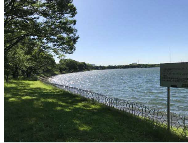
久喜菖蒲公園(昭和沼)