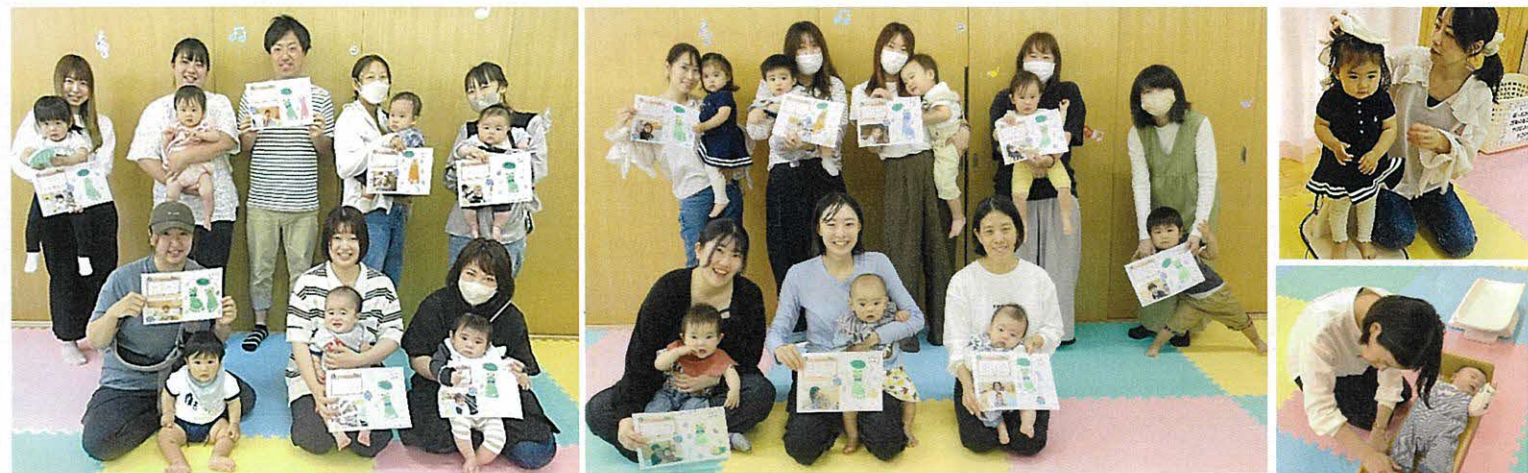
健やかな成長を見守っていきましょうね♪