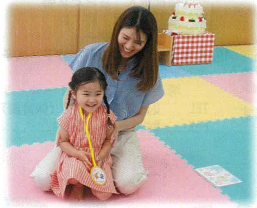
パネルシアターを見て楽しくすごしました!