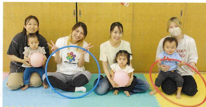
ボール・フラフープ・バルーンを使ってみんなで一緒に楽しく体を動かして遊びました!