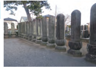
⑫-1 深廣寺・六角名号塔