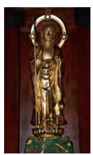
④ 経蔵院・乾漆地蔵菩薩立像 (非公開)