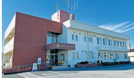
久喜市役所(第二庁舎)