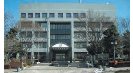
菖蒲行政センター