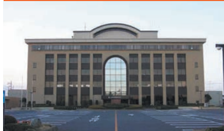
鷺宮行政センター