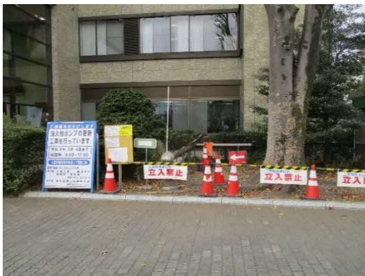
(設備の更新工事の状況)

現在の本庁舎は、竣工から既に45年を経過し、様々な機械設備の老朽化が進行しています。