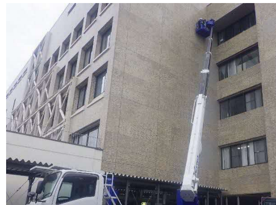
(外壁修繕工事の状況)