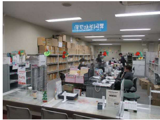
(執務室に積み上げられた保存箱)