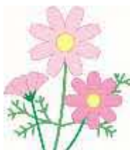
久喜市の花「コスモス」