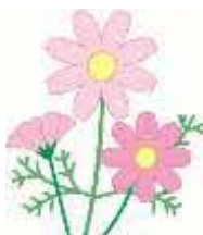
久喜市の花「コスモス」