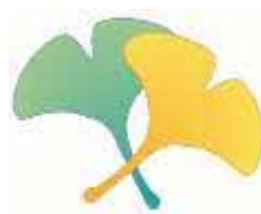
久喜市の木「イチョウ」