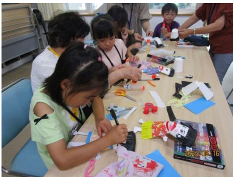
【講座】パクパク人形