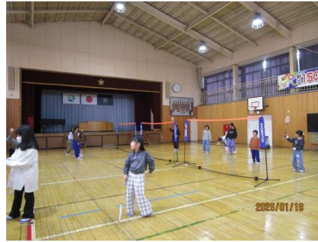
【講座】バドミントン