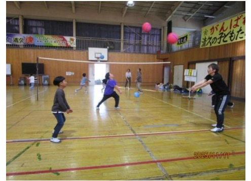
【講座】ソフトバレーボール