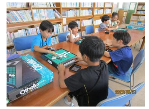
【講座】将棋・オセロ・カードゲーム