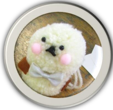
【講座】ポンポンマスコット