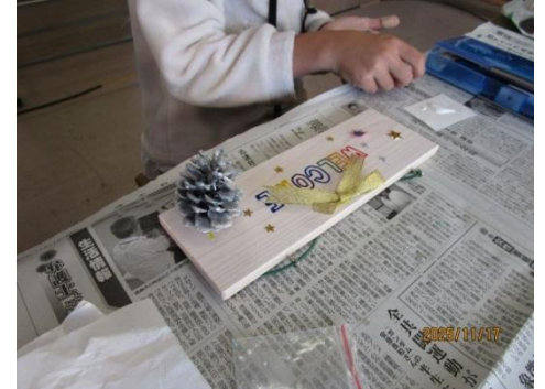
【講座】ウエルカムボード