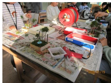
【講座】ジオラマ作り