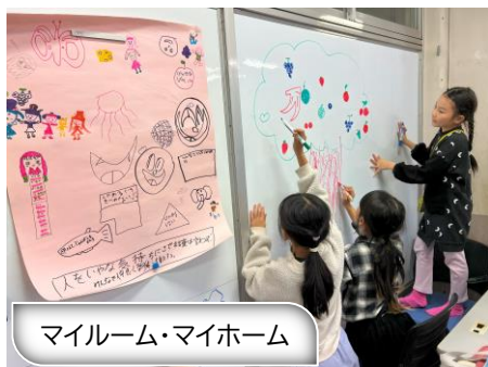
マイルーム・マイホーム