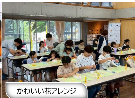
かわいい花アレンジ