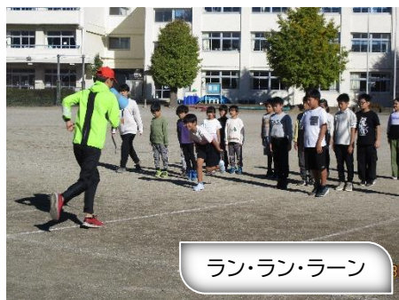
ラン・ラン・ラーン