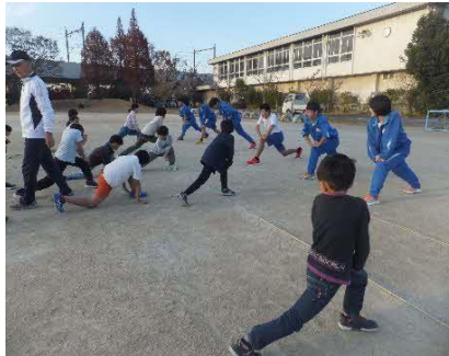
講座「陸上競技」サポーター （みなみっ子・栗橋東中）