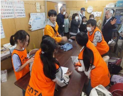
活動記録集計（くきっ子）