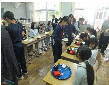
講座「茶道」サポーター （三箇・菖蒲中）