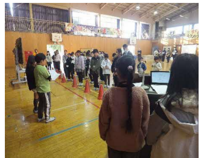
論語を唱える（清久っ子）