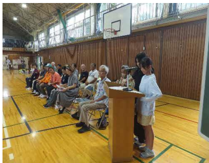
開校式司会（えづらっ子）