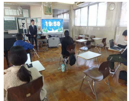
講座「パソコン遊び」指導者 （すなはら・鷺宮中）