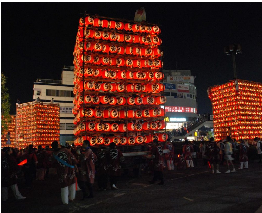
ちょうちん 久喜提燈祭り「天王様」の様子