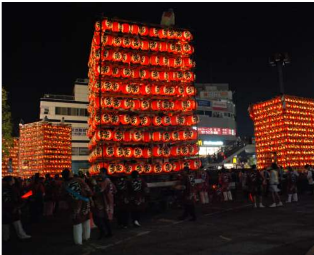
ちょうちん 久喜提燈祭り「天王様」の様子