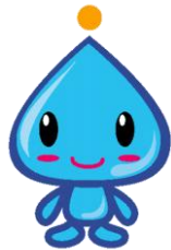
久喜市水道事業マスコットキャラクター 「みず坊」