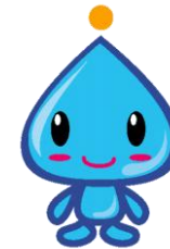
久喜市水道事業マスコットキャラクター 「みず坊」