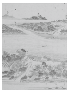
▲栗橋関所と房川渡し

る最適な一冊です。 ※市内の各図書館でもご覧になれます。 頒布場所 文化財保護課、郷土資料館、公文書館 価格 900円 問合せ 文化財保護課文化財・歴史資料係(菖蒲総合支所内/内線372)