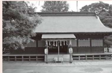
▲鷺宮1丁目の鷺宮神社

心とする地域が荘園となったもので、鷺宮神社は、太田荘の開発領主である太田氏に因与する神社として発展し、太田荘の総鎮守といわれていました。分社の分布状況からも、その信仰圏が太田荘を中心としたものであることが分かります。