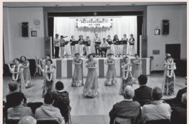
▲ 2月15日(日) 鷺宮公民館まつり発表の部