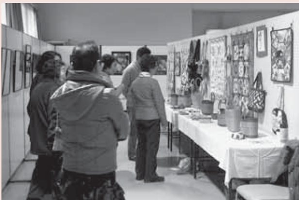
▲ 2月21日(土)・22日(日) 森下公民館まつり