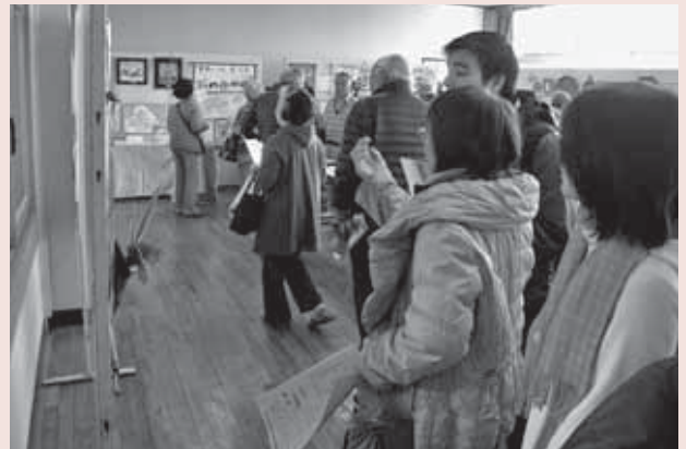
▲ 2月21日(土)・22日(日) 栗橋公民館利用団体の作品展