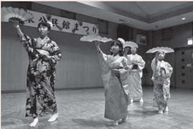
▲ 2月20日(金)・21日(土)・22日(日) 東公民館まつり