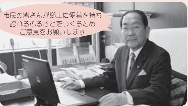
市民の皆さんが郷土に愛着を持ち 誇れるふるさとをつくるため ご意見をお願いします

みなさんの声を市政に反映させることを目的に、市長をはじめ市の執行部職員が皆さんのお住まいの地域に出向き、ご意見やご提案をお伺いします。