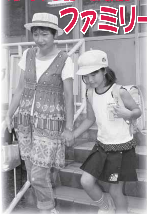
学童クラブのお迎え援助中の様子