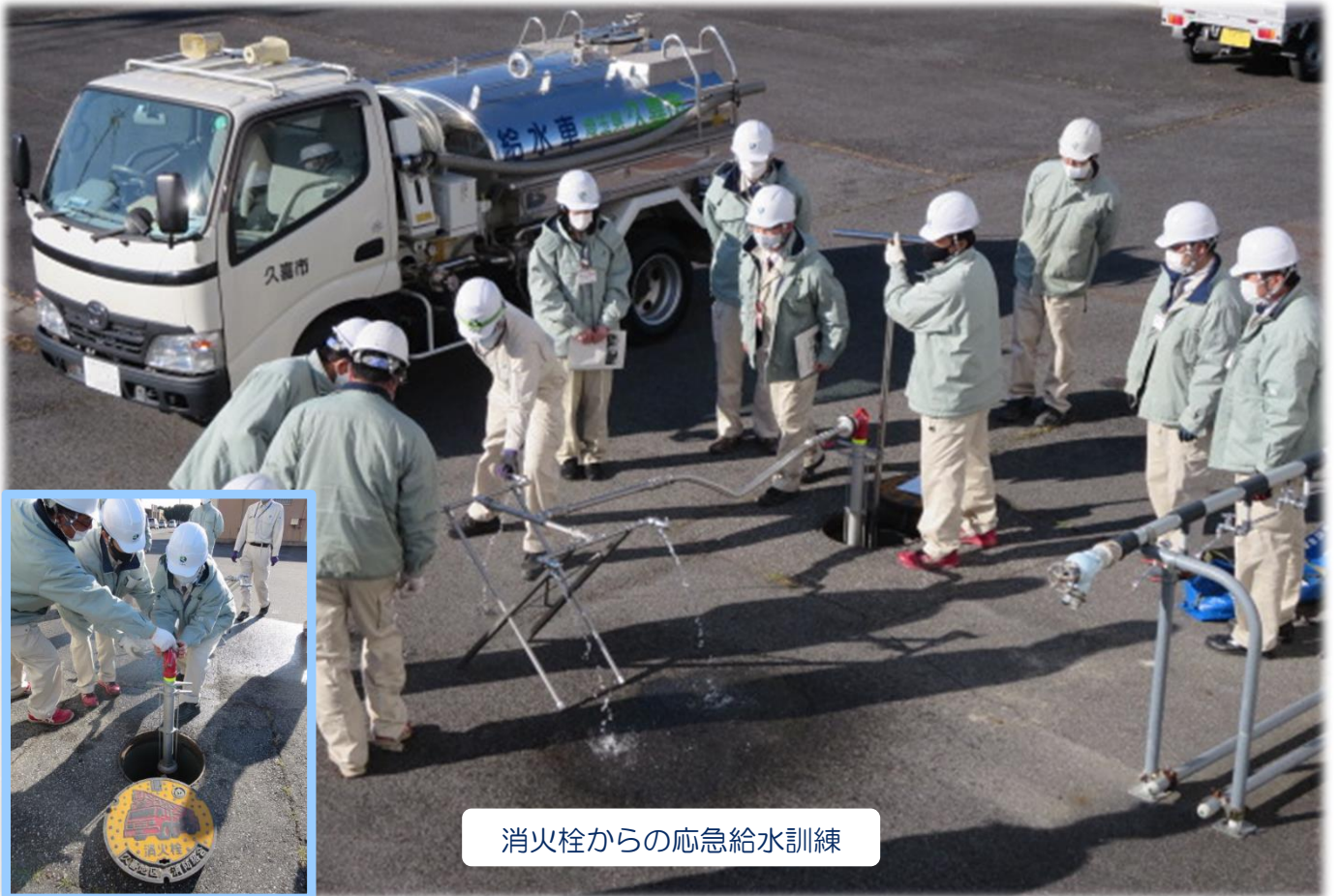
消火栓からの応急給水訓練