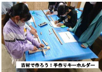
古村で作ろう！手作りキーホルダー