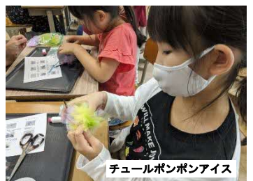
チュールポンポンアイス