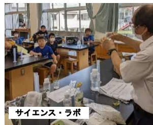
サイエンス・ラボ