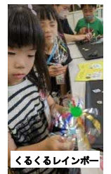
くるくるレインボー