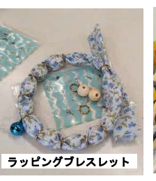
ラッピングプレスレット