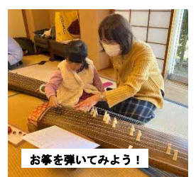
お箏を弾いてみよう！