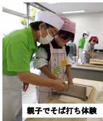
親子でそば打ち体験